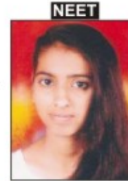
प्रिया सोनी गंगाविशनजी मौसूण